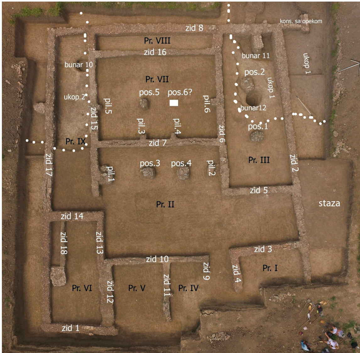
Slika 10 – Objekat 10, villa rustica

objektu bio je sa severne strane, gde je sačuvana prilazna staza nasuta peskom, dimenzija 3,90 x 2,90 x 0,05 m. Spoljni zidovi objekta (zidovi 1, 2, 8 i 17) su sačuvani u temeljima, na relativnoj dubini od oko 0,45 m. Njihova širina varira od 0,75 m do 0,85 m, dok im je očuvana visina oko 0,80 m. Jedino zid 2 u severozapadnom delu doseže visinu od 1,20 m, jer je bio izgrađen preko starijeg ukopa, do čijeg dna u zdravici je morao da bude fundiran. Svi zidovi su konstruisani od sitnih ulomaka crvenke, samo su spojevi zidova 1 i 2 i zida 2 sa zidovima 3 i 5 bili ojačani škrljcem u dužini od 0,70 m. Na tim mestima mogu se očekivati baze za stubove