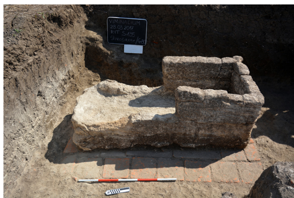
Slika 4a-d –G-86, G-92, G-118 i G-80