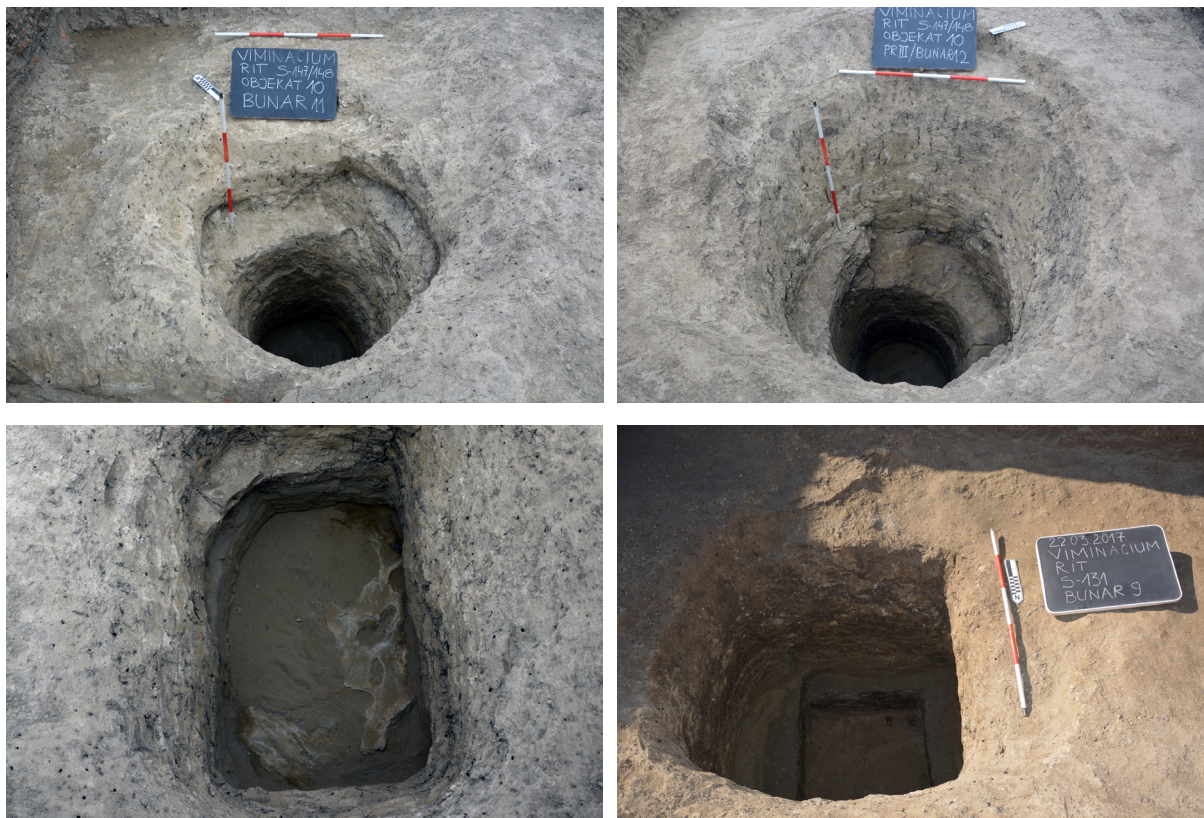
Slika 8a – Objekat 10, prostorija III, bunar 11; 8b – Objekat 10, prostorija III, bunar 12; 8c – Objekat 10, prostorija IX, bunar 10; 8d – Sonda 131, ukop 1, bunar 9

Severoistočno od objekta 10, istražen je deo većeg ukopa 1 koji obuhvata sonde 131 i 135 i širi se i izvan njih (sl. 9). Iako nije bilo mogućnosti da se istraži u potpunosti, može se reći da taj ukop predstavlja još jedno pozajmište za glinu iz 1. i 2. veka. U gornjim slojevima, ukop zahvata celu površinu sonde 131 (10 m x 5 m), da bi se od dubine 1,20 m postepeno sužavao i pratio u dužini od 8,30 m i širini od 3,90 m. Dno ukopa je u sloju zdravice, na dubini od 1,85 m. Isti ukop je istraživan i u susjednoj sondi 135, koju je od sonde 131 delio kontrolni profil širine 0,50 m. U ovoj sondi, dimenzija 10 m x 10 m, ukop 1 je uočen na relativnoj dubini od 0,75 m. Na dubini od 1,10 m postepeno se sužava, dok je dno dokopano na dubini od 2 m.