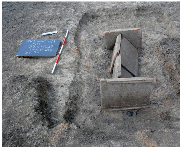
Slika 3 – G-51

ža grobova tipa Mala Kopašnica–Sase bili su oštećeni ukopavanjem grobova inhumiranih pokojnika sa konstrukcijom od opeka iz kasnije faze sahranjivanja. Tri groba tipa Mala Kopašnica Sase II su imala donji etaž napravljen od opeka. U grobovima kremiranih pokojnika donji etaž je pravougaonog oblika, zaobljenih uglova, sa više ili manje ostataka gareži, pepela i spaljenih kostiju. Donji etaž groba G 1 -51 bio je pokriven konstrukcijom u vidu dvoslivnog krova (sl. 3), koja je osobenija za inhumacije na ovom prostoru. Zidovi oba etaže su crveno do sivo zapečeni, debljine od 3 do 5 cm. Grobni prilozi su uobičajeni za ovaj oblik sahrane: keramički krčazi i pehari, lampe i bronzani novac. Istom horizontu pripada 18 skeletnih