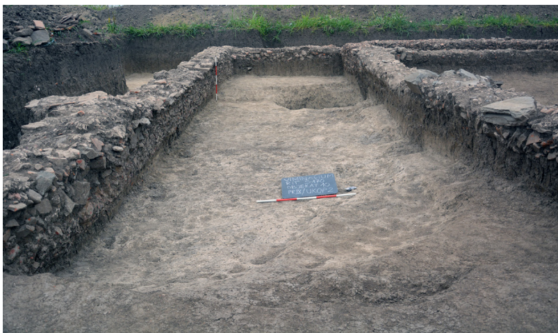
Slika 7b – Objekat 10, prostorija IX, ukop 2

se širi do 3,20 m, a van njega još 1,30 m, gde zalazi pod južni profil sonde (sl. 7b). Ukop se sa severne strane završava na oko 0,30 m zida 15. Nepravilnog je oblika i levkasto se sužava do najveće dubine od 1,50 m gde je ukopan u sloj žute, arheološki sterilne zemlje. Bio je ispunjen fragmentima keramičkih posuda, životinjskim kostima, gvozdanim klinovima, oplatama od bronzе, kao i ulomcima opeka, tegula i kamena škrljca.