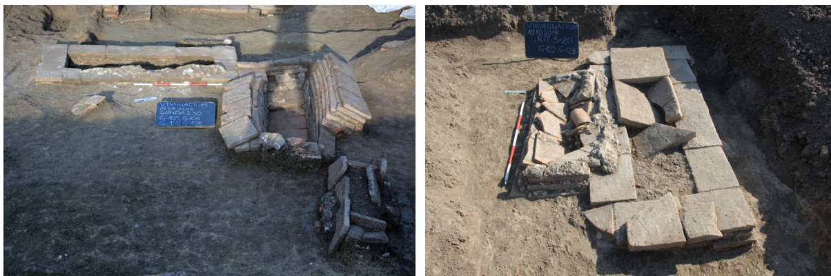
Slika 5a – G-103–G-106; 5b – G-122 i G-123

Mlađa faza nekropole može da se datuje u 3. vek, jednako kao vile rustike u istoj zoni duž puta. Sahranjivanje inhumiranih pokojnika u toj fazi je nastavljeno u grobovima od opeka i u sarkofazima. Nađena su tri olovna (G-86, 92 i 118, sl. 4a–c) 3 i jedan kameni sarkofag (G-80, sl. 4d). Sahranjivanje se vrši sve do poslednjih decenija 3. veka, kada prestaje i korišćenje vila rustika 2 i 3. Olovni sarkofazi iz G-86 i G-92 bili su položeni u grobove sazidane od opeka. Posebna specifičnost groba G-92 je u tome što nije imao uobičajeni poklopac od olova, već olovnu ploču položenu preko sarkofaga čije su se ivice oslanjale na konstrukciju groba, a ne na sam sarkofag. Preko poklopca su zatim ozidana dodatna četiri reda opeke. Svi grobovi sa sarkofazima su bili opljačkani.