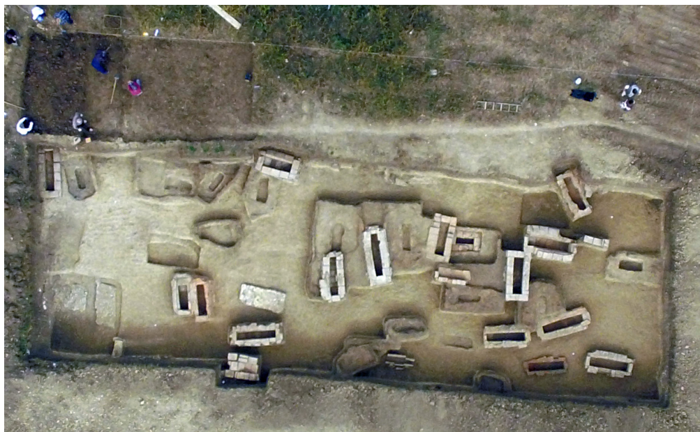
Slika 2 – Deo antičke nekropole, odozgo

Istraživanjima 2017. godine bio je obuhvaćen niz manjih nekropola koje su se pozicionirale duž puta od Viminacijuma ka Lederati. Između tih malih groblja, koja bi se u konačnoj interpretaciji mogla posmatrati i kao jedna celina zbog veoma sličnih osobina, umetnule su se tri vile rustike koje su, kao što je navedeno, istovremene sa drugom fazom sahranjivanja. Iako nije zahvatala ni najveći prostor niti spada u veće po ukupnom broju pokopanih individua, gustina sahranjivanja na ovoj nekropoli je među najvećim na prostoru Viminacijuma. Grobovi obe faze bili su grupisani sa vrlo malo ili skoro bez slobodnog prostora.