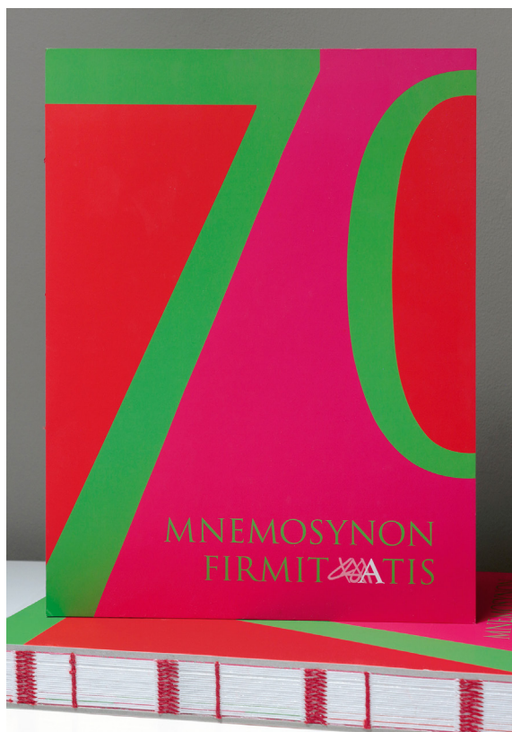
Slika 1 – Mnemosynon firmitatis: sedamdeset godina Arheološkog instituta (1947-2017)

Taj trud nas je osnažio u uverenju da je značajno da sabiramo i prezentujemo rezultate koje ostvarimo u toku svake godine. Stoga je ova, sedma po redu sveska zbornika Arheologija u Srbiji , koja se uz poslovično zakašnjenje odnosi upravo na 2017. godinu, uz uobičajene izveštaje sa iskopavanja i rekognosciranja i prikaz stručnog i naučnog rada na određenim problemima opremljena i opširnim uvodnim izveštajima o radu na četiri matična projekta Arheološkog instituta. Uz ostalo, ti izveštaji, sačinjeni po ugledu na godišnjake velikih evropskih instituta, sadrže i kompletnu bibliografiju učesnika na projektima i ažurne podatke o kongresima, konferencijama i radionicama na kojima su izlagali.