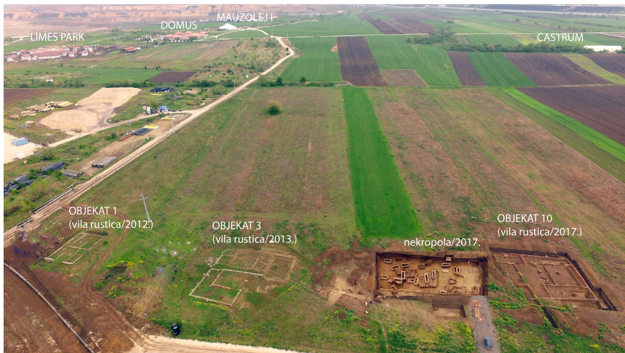
Slika 1 – Prikaz vila i nekropole u Ritu, situacija iz 2017. godine, pogled sa severa