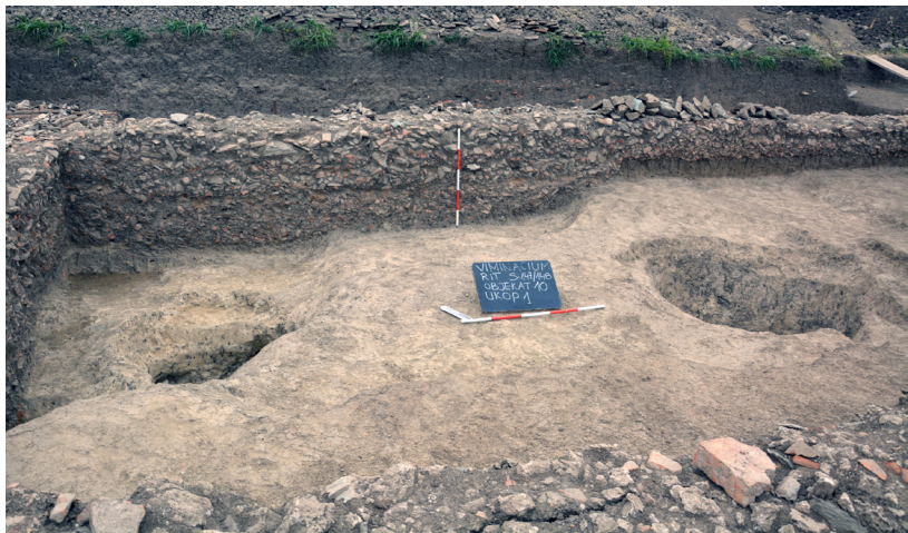
Slika 7a – Objekat 10, prostorija III, ukop 1

Ukop 1, konstatovan na dubini od 0,90 m, zalazi ispod zapadnog i severnog zida prostorije III (sl. 7a). Maksimalna istražena dužina ukopa iznosi 11,50 m, dok je širine 3,90 m. Ukop 1 nije ujednačene dubine, već se stepenasto spušta prema profilima sonde. Dno ukopa je na najvećoj relativnoj dubini od 2,30 m. Ukop 2 je uočen u gabaritu i izvan prostorije IX, na dubini od 1,20 m. Ukop, maksimalne dužine 8,65 m, unutar objekta