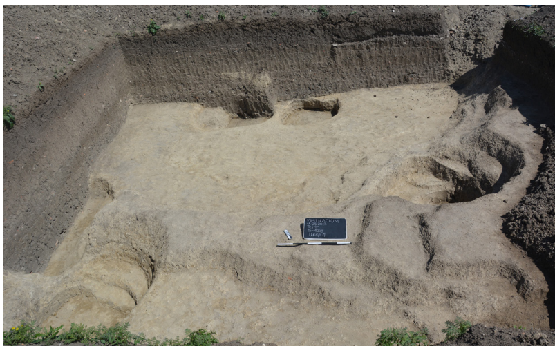
Slika 9 – Sonda 135, ukop 1 sa jamama

od 2,65 m. Jama 3 je ovalna, ukopana neposredno uz jamu 2. Uočena je na dubini od 2,30 m, većim delom zalazi u severni profil sonde, a istražena je u površini od 2,20 m x 1,60 m. Dno jame 3 je konstantovano na dubini od 3 m. Jama 4 je uočena u jugozapadnom delu sonde, na dubini od 1,90 m. Ovalnog je oblika, dimenzija 2,50 m x 2,05 m. Dno jame je na relativnoj dubini od 2,55 m. Uz severnu ivicu jame 4 je konstantovan deo jame 5, koja većim delom zalazi u zapadni