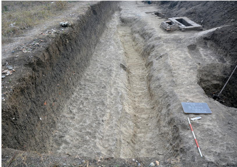
Slika 6 – Sonda 264, rov 1

tamnorka zemlja sa ulomcima keramičkih posuda, životinjskim kostima i komadima škriljca, krečnjaka i opeka. Ovaj rov, koji se verovatno nalazi sa južne strane puta koji do Lederate, predstavlja grubu granicu nekropole. Severno od puta konstatovano je više pojedinačnih grobova iz svih perioda, uglavnom uništenih ili oštećenih, ili u manjim, nepovezanim i međusobno udaljenim grupama. Situacija je dakle veoma različita od one koju srećemo sa južne strane puta.