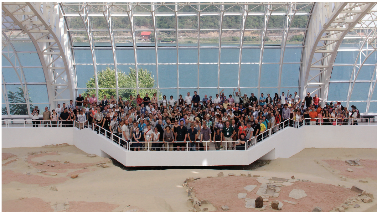
Slika 4 – Učesnici MESO 2015 konferencije prilikom posete Muzeju Lepenskog Vira, 16. septembar 2015.