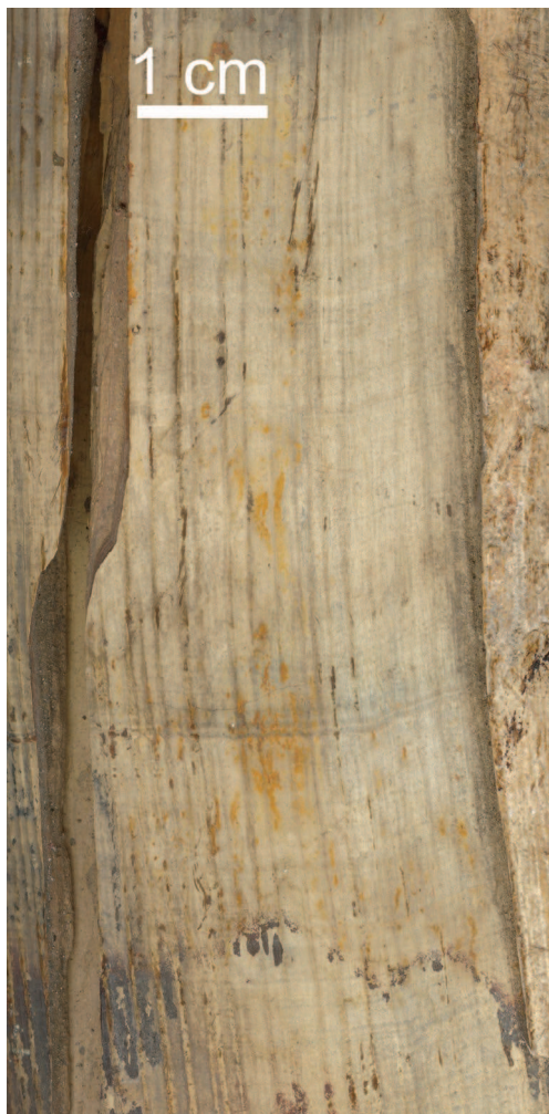
Figure 6. Surface of a mammoth tusk that match the item from Romuliana in structure and color

Слика 6. Површина кљове мамута која се поклапа са предметом са Ромулијена по структури и боји