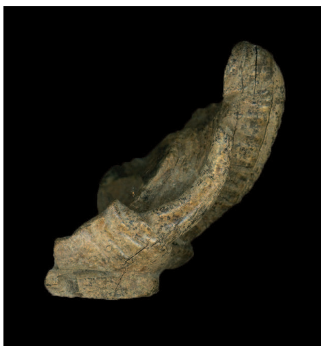
Figure 2. Fragment of ivory elephant head from Romuliana with tusks and upraised trunk (right profile) Слика 2. Фрагмент главе слона од кљове са Ромулијане са кљовама и подигнутим трупом (десни профил)