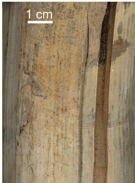
Figure 7. Detail of a mammoth tusk surface Слика 7. Детаљ површине кљове мамута

could not be sure what was the original shape and function of this item. It is possible that it was the box with the lid in the shape of the elephant head and recipient in the shape of the animal's body (Петковић 2005: 80–81). This pyxis could have been used as a recipient for luxurious cosmetic preparations, aromatic ointments, make-up pigments, powder or rare medicine. In any case, we could assume that the figurine of elephant had a composite structure or that the proteome of the elephant was attached to other material, the most probably wood. The bone