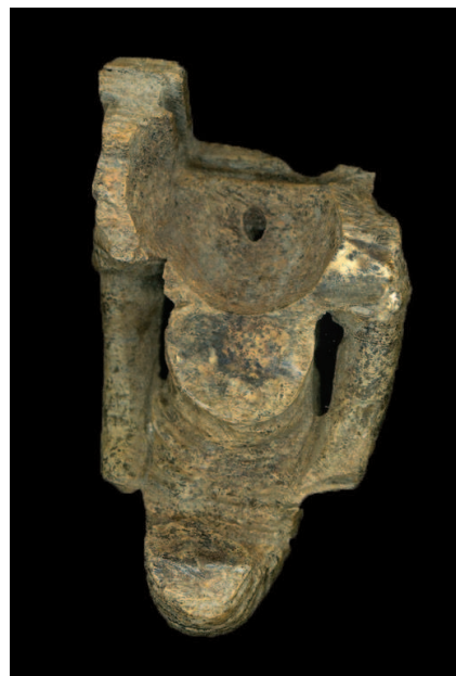
Figure 3. Ventral side of the fragment of ivory elephant figurine from Romuliana