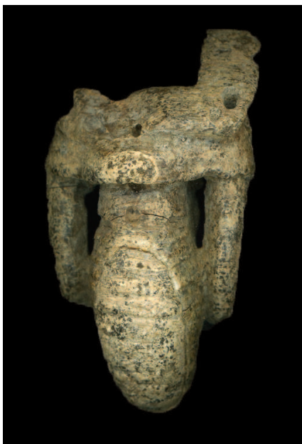
Figure 4. Distal side of the fragment of ivory elephant figurine from Romuliana

Слика 4. Дистална страна фрагментоване фигурине слона од кљове са Ромулијане