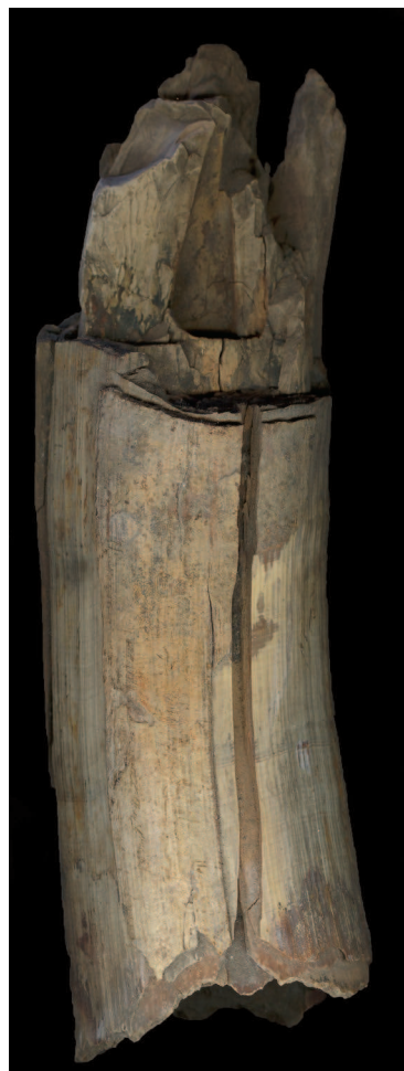
Figure 5. A part of a mammoth tusk which matches the material of item from Romuliana

Preserved fragment, dimensions of 5.5 x 3 x 2.5 cm, was carved in three-dimensional way, in full relief. The item was manufactured by carving and polishing in a very sophisticated way, so that the elephant head has been represented realistically. The missing upper part of the animal's head was once attached to the preserved lower part by small pegs, which could be observed through the two small holes above the tusks (Figures 3–4). At the joint part of head and body of the animal, i.e. neck, there is a flat part in the square form preserved (Figure 4). Beneath it, inside the item, a deep groove of unclear function was cut (Figure 3). Along the rims of the flat, square surface there are three small holes, once used to attach the head to the body with small bone or wooden pegs, as there have been no traces of metal corrosion. The inside of the item, that is the lower part of elephant head, was carved in the semispherical shape and polished (Figures 1 and 4). Also, in the center of