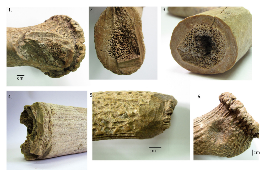
Puc.\ 1. Обломки и заготовки из рога оленя со следами резания металлическим инструментом: 1-3 – поперечная резка, 4 – рубило/нагартовка, 5 – беление, 6 – незавершенная перфорация.

воздействием, другие — рубились или строгались большим металлическим режущим орудием. Другим способом, который использовался для получения заготовок более правильной формы, была поперечная резка. Сегменты ствола и отростков рога обычно распиливались поперек либо полностью по окружности, либо частично, а затем оставшаяся часть отрезалась, отламывалась или отщелкивалась (рис. 1, I-3). Чаще всего это делалось небольшим металлическим лезвием, скорее всего зубчатым.