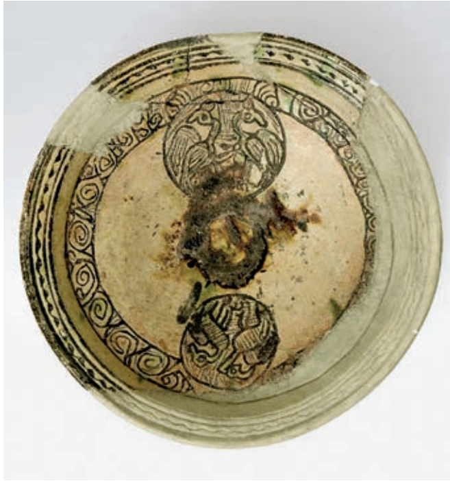
Fig. 102. Sgraffito plate from Stalać, end of the 14 th -beginning of the 15 th century

medieval society, 28 it seems certain that the local aristocracy must have had some sort of role in the organisation of the pottery trade, 29 or, it is assumed that taxation existed on the said goods and activities. In other words, control of the manufacture and trade of ceramic items was in the hands of a patron of those activities – the local nobleman, and indirectly the state, which means the ruler.