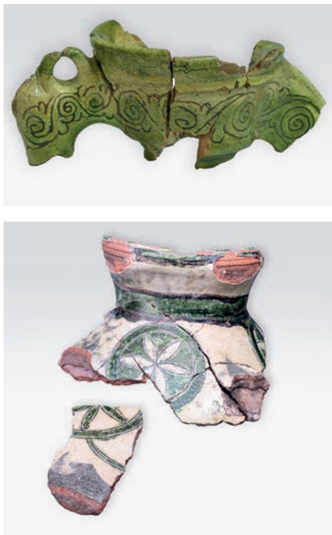
Fig. 97. Motifs from Serbian medieval ceramics of the 14 th –15 th century: a) Kruševac, b) Maglič

The Byzantine spirit of Serbian sgraffito ceramics is revealed most eloquently in its aesthetics, in the choice and arrangement of the motifs and the colouring of the vessels. The available material, proportionately numerous and diversified, offers sufficient elements for roughly establishing a chronological and decorative scheme. Nevertheless, when interpreting the phenomena, a certain measure of caution is required because of the (still) insufficient number of samples of pottery and the different degrees to which the monastery complexes, settlements and fortified cities of medieval Serbia have been explored. Owing to circumstances connected with the extent of exploration and because