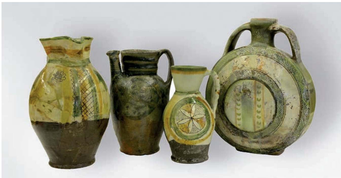
Fig. 101. Table vessels from the Studenica monastery, 14 th – first half of the 15 th century