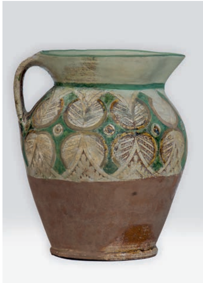
Fig. 98. Pitcher from the Gradac monastery

The final heyday of Serbian artistic pottery in the first half of the 15 th century is represented by vessels from Smederevo. Like Kruševac, this table assemblage was made to order for the palace of Despot Đurađ Branković where it was used for almost 30 years (between 1428/30 and 1459). 16 The large decorative patterns on the beautifully shaped vessels make the ceramics from the Smederevo castle quite recognisable, and also different in the interpretation of the Byzantine patterns, in comparison to the ceramics from Kruševac or Raška.